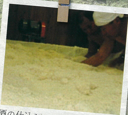
酒の仕込み、新酒が飲めるまで・・・