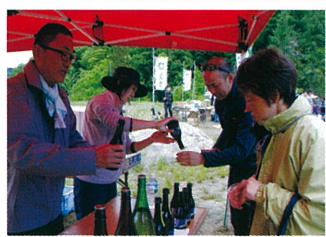
BBQ・黒菱 & 日本酒の振る舞い