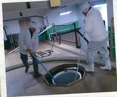
杜氏が手間暇をかけて・・・