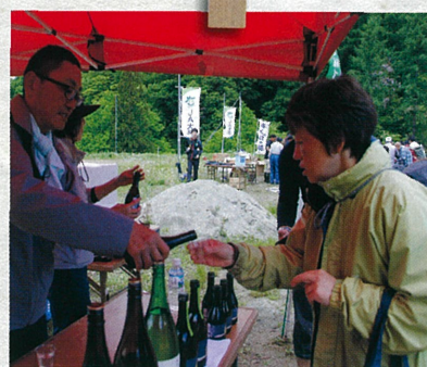
稲刈りのあとは振る舞い酒や・・・