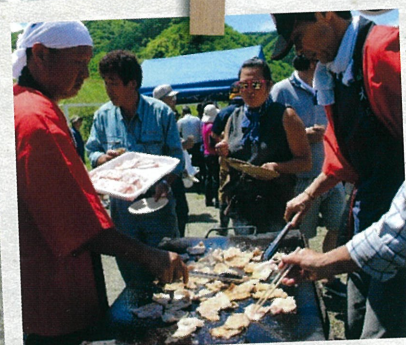
豪華 BBQ も！！！！