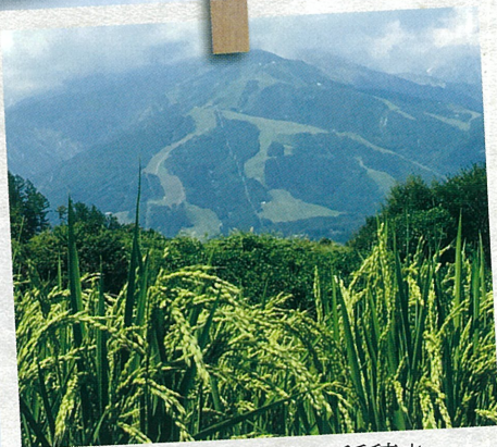
夏：白馬の水と日光で稲穂をつけました。