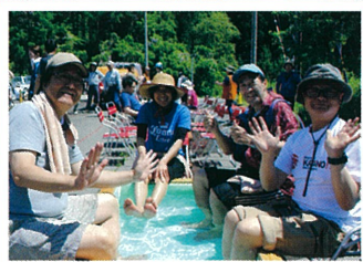
足湯でリラックス