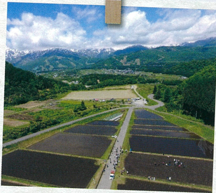
北アルプス、白馬八方尾根を正面に望む東山、野平地区。