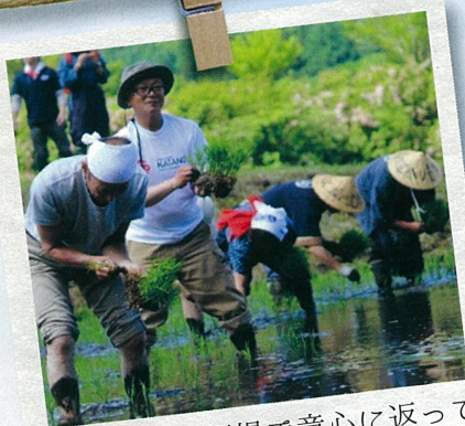
春：棚田の圃場で童心に返って泥まみれ！