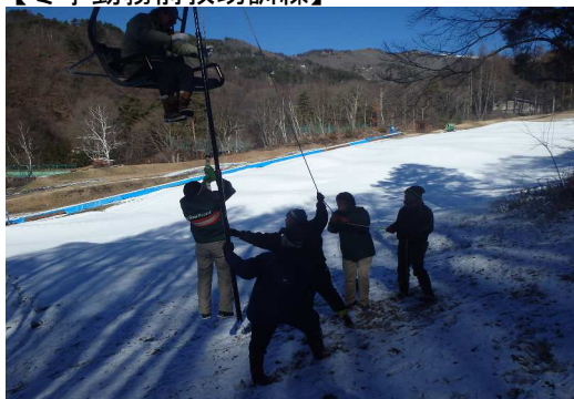
【冬季勤務前救助訓練】