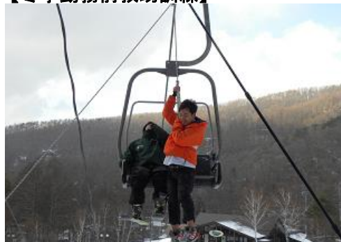
【冬季勤務前救助訓練】