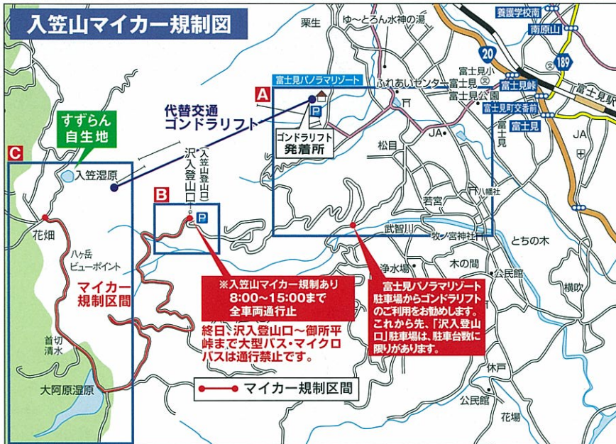
A 拡大図 富士見パノラマリゾート周辺