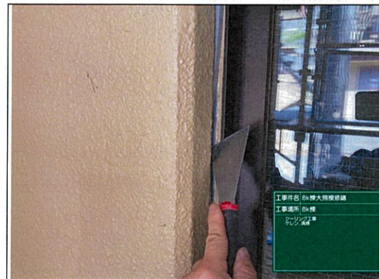
工事内容: 8K棟大規模修繕 工事場所: 8K棟 シーリング工事 ケレン