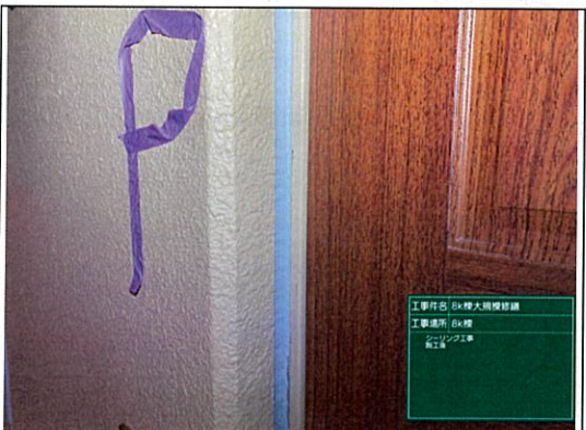
工事内容: 8K棟大規模修繕 工事場所: 8K棟 シーリング工事 施工後