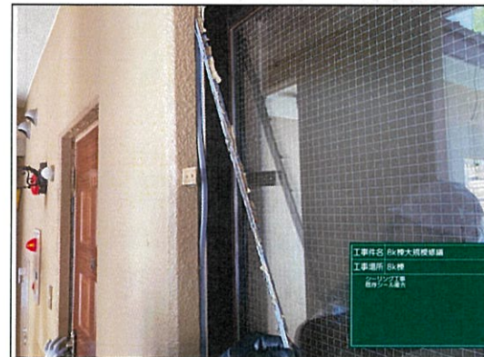
工事内容: 8K棟大規模修繕 工事場所: 8K棟 シーリング工事 既存シール 撤去