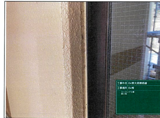
工事内容: 8K棟大規模修繕 工事場所: 8K棟 シーリング工事 施工前