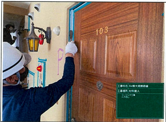
工事内容: 8K棟大規模修繕 工事場所: 材料搬入 シーリング工事 ヘラ均し